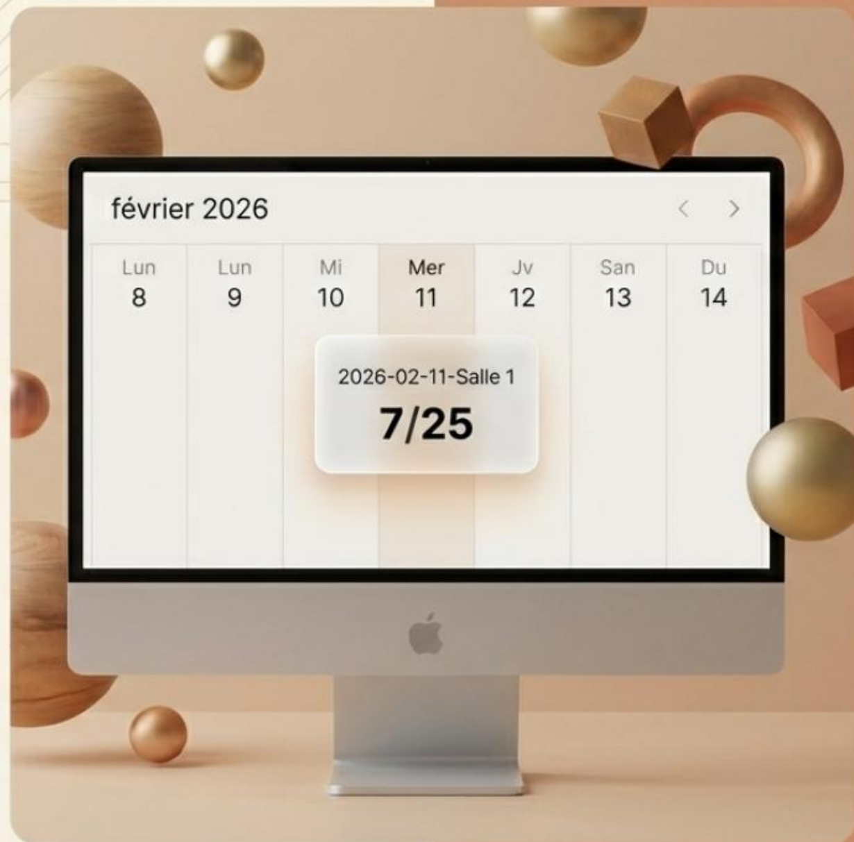
Tableau de bord opérationnel. Vue chronologique pour le personnel, permettant une gestion visuelle et immédiate du taux d'occupation.